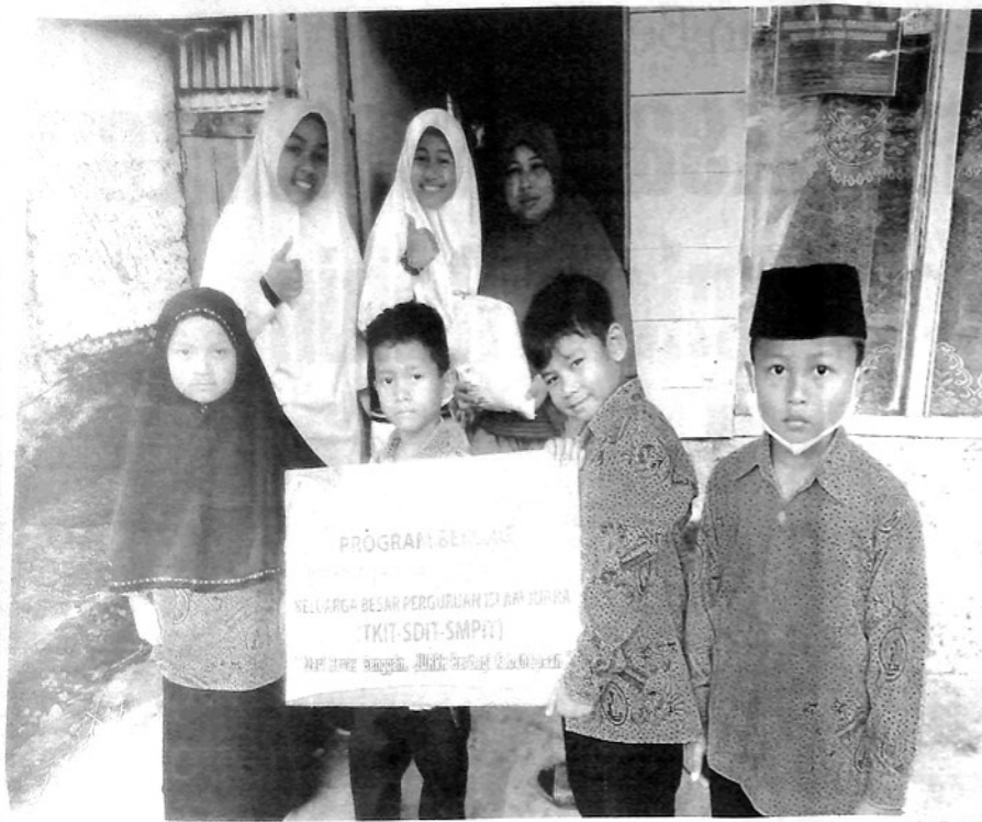
BANTUAN BERAS— Beberapa orang anak-anak Perguruan Islam JUara memperlihatkan bantuan beras genggam.