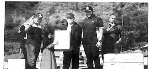
PENYERAHAN hadiah kepada salah seorang warga yang beruntung mendapatkan doorprize.

Rice juga mengucapkan terima kasih atas kehadiran Wako Fadly. Sehingga apa yang menjadi inspirasi yang tadinya belum tersampaikan, jadi langsung tersampaikan. (ned)