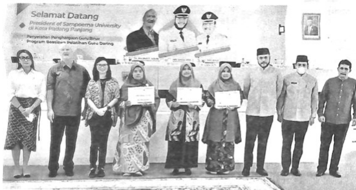
PENYERAHAN penghargaan Guru Binar Program Beasiswa Pelatihan Guru Daring dari Putra Sampoerna Foundation.

PADANGPANJANG, KP - Tiga guru Kota Padangpanjang terima penghargaan Guru Binar Program Beasiswa Pelatihan Guru Daring dari Putra Sampoerna Foundation di Hall Lantai III Balai Kota Padangpanjang, Jumat (12/8).