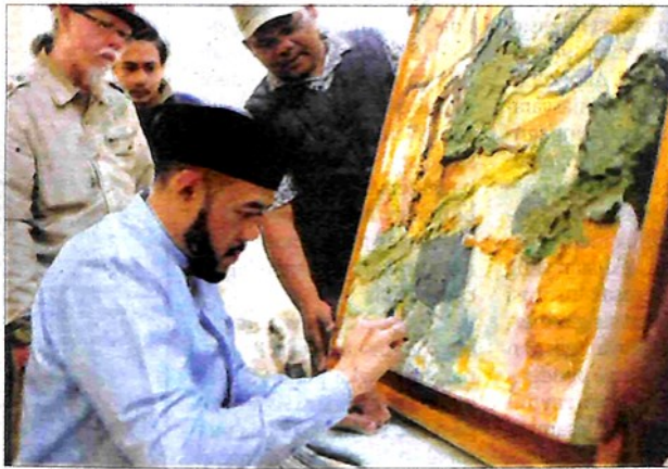
ASET PEMKO: Wali Kota Padangpanjang Fadly Amran menerima karya lukis Erizal AS yang berjudul Impresi Rumah Gadang PDIKM , Jumat malam (12/8) lalu.